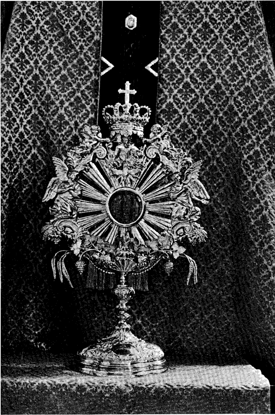
Monstrans uit 1743