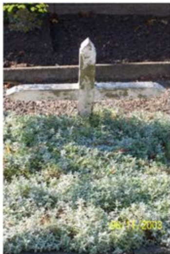
SECTIE K RIJ 2: K12 N.N. onbekend kind ~ EINDE FOTORONDE ~

~START NIEUWE RONDE~ SECTIE A RIJ 1: A3-4 (wed. werd 1 eeuw oud) Echtp. Janssen-Rutten (80, 100 jr.)