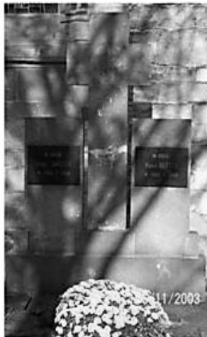
RIJ 1: A3-4 (wed. werd 1 eeuw oud) Echtp. Janssen-Rutten (80, 100 jr.)