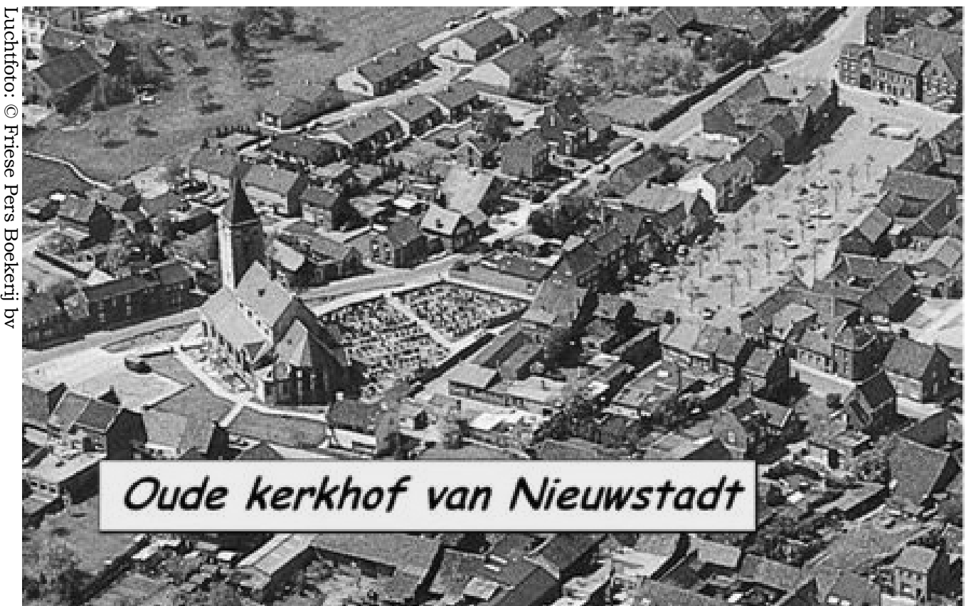
Oude kerkhof van Nieuwstadt