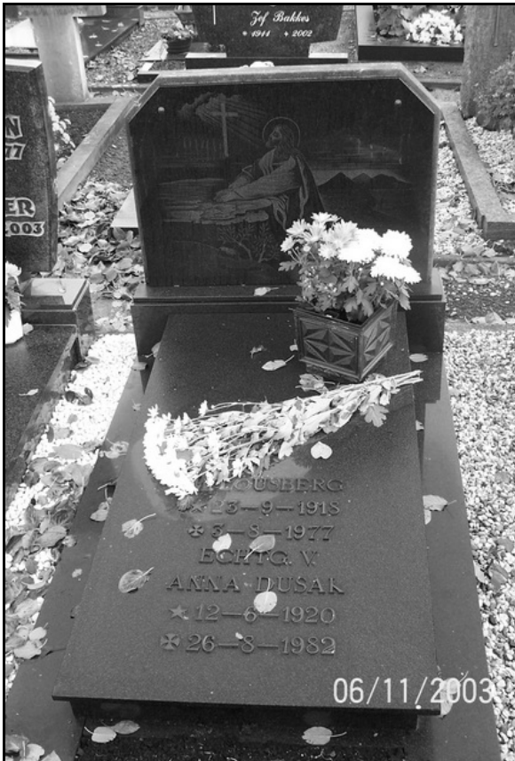
St. Jan kerkhof, Nieuwstadt; grafnr. B138